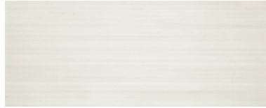
Spirit blanco 20x50/8"x20"