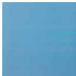
Basic azul 28 33,3x33,3/13"x13"