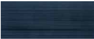
Spirit marine 20x50/8"x20"