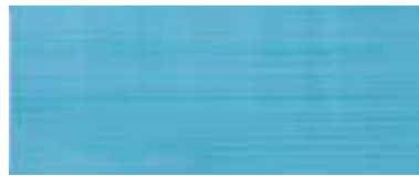
Spirit azul 20x50/8"x20"