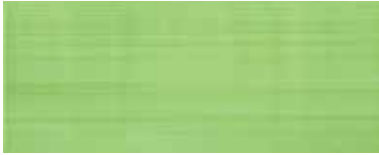
Spirit pistacho 20x50/8"x20"