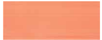
Spirit orange 20x50/8"x20"