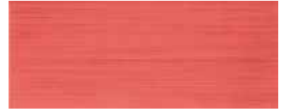
Spirit rojo 20x50/8"x20"