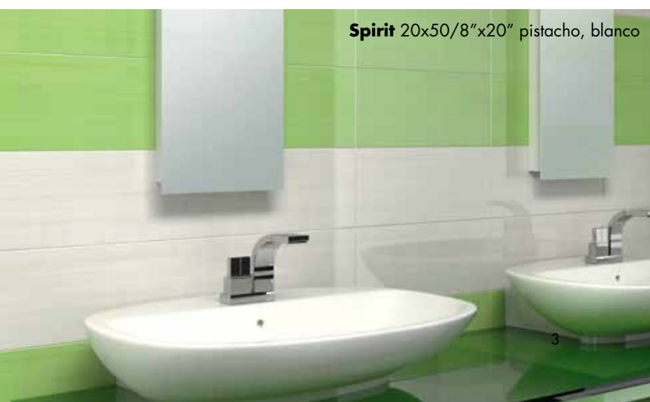
Spirit 20x50/8"x20" pistacho, blanco

Für jene gedacht, die ihre Zeit in unbeschränkter Freiheit verbringen wollen. Spirit ist eine lebhafte und angenehm auffallende Kollektion. Das Spiel der Farben, der Linien und des Design verleiht auch einem ernsten Ambiente die Stimmung eines "freien Geistes".