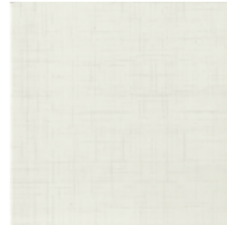
Basic blanco 28 33,3x33,3/13"x13"