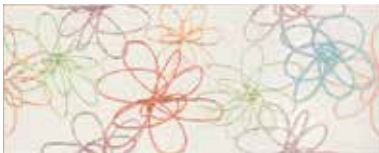
Spirit decoro iris multicolor 20x50/8"x20"