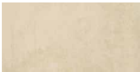
Pianeti beige rect. 30x60/12"x24"