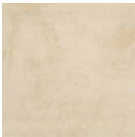
Pianeti beige rect. 60x60/24"x24"