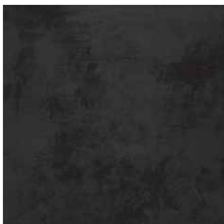
Pianeti black rect. 60x60/24"x24"