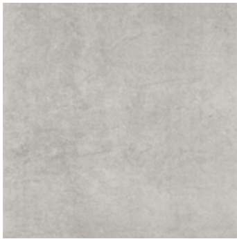
Modus grigio 7 45x45/18"x18"