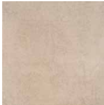
Modus beige 7 45x45/18"x18"