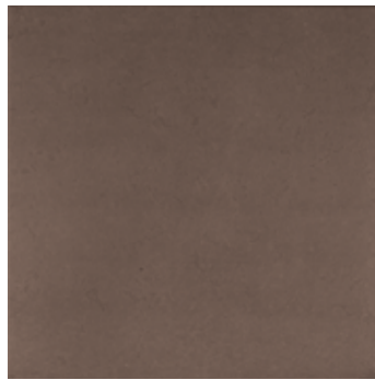
Modus cacao 7 45x45/18"x18"