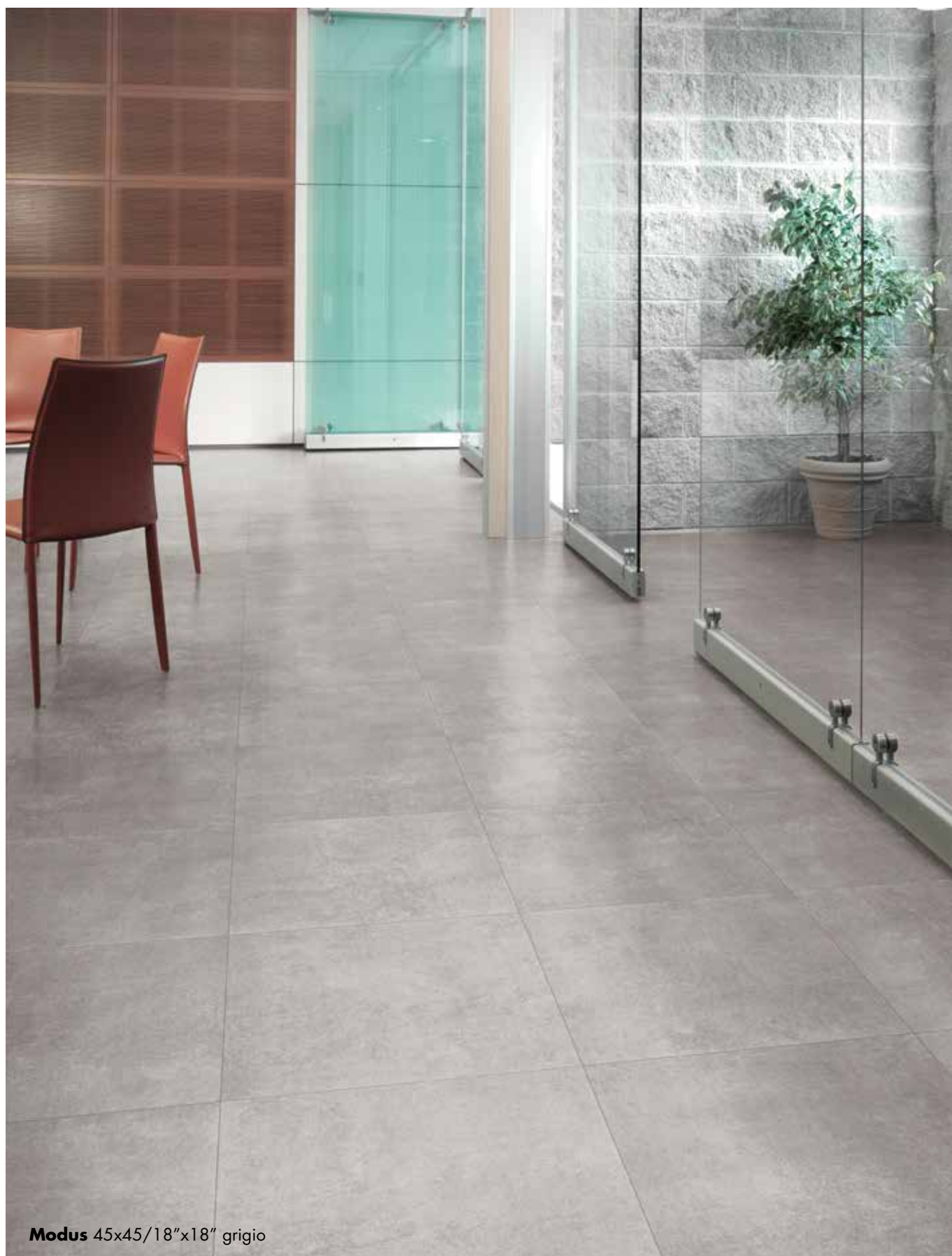
Modus 45x45/18"x18" grigio