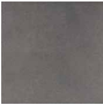
Modus antracite 7 45x45/18"x18"