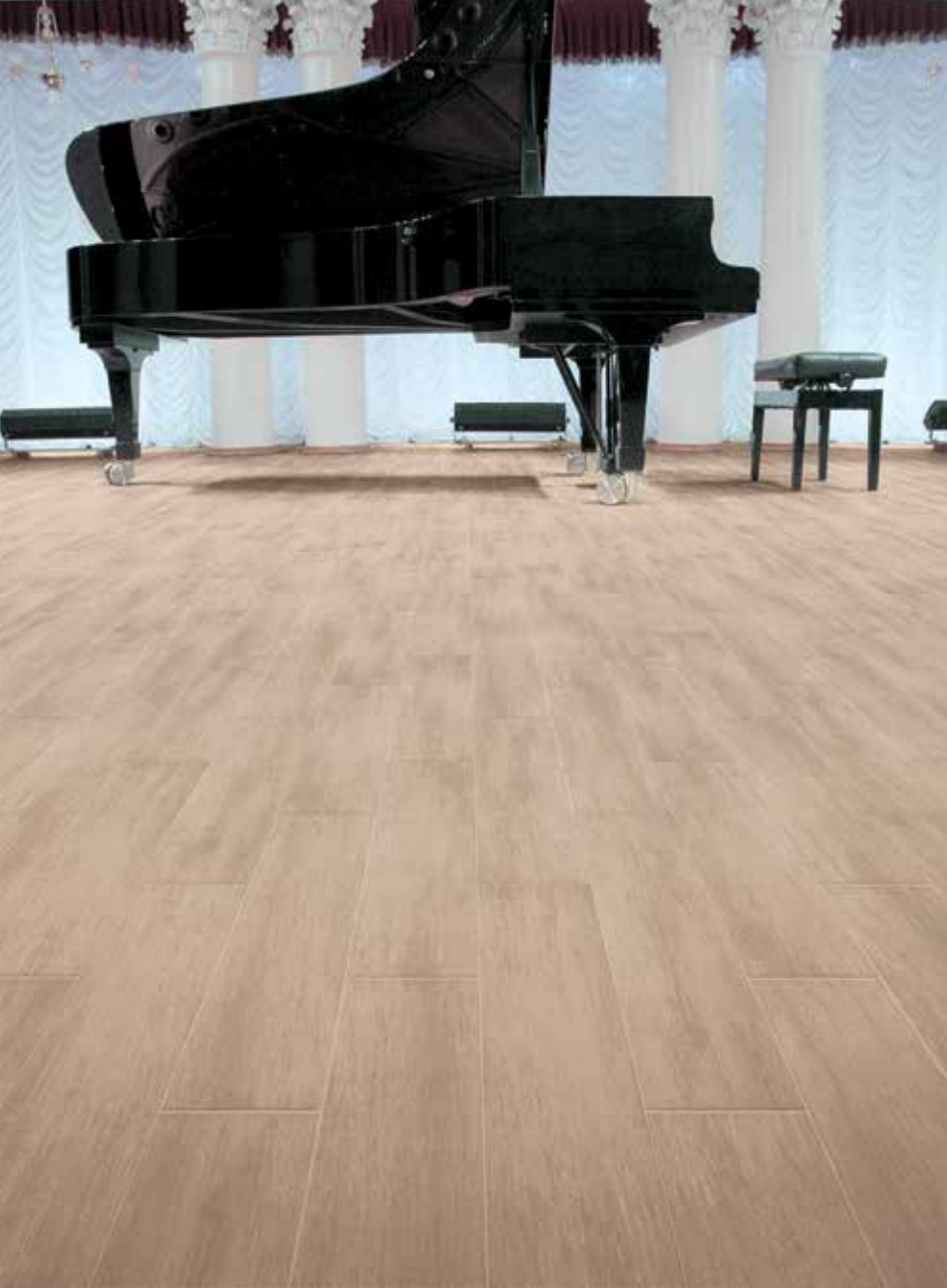
Just wood 15x60,5/6"x24" vanilla