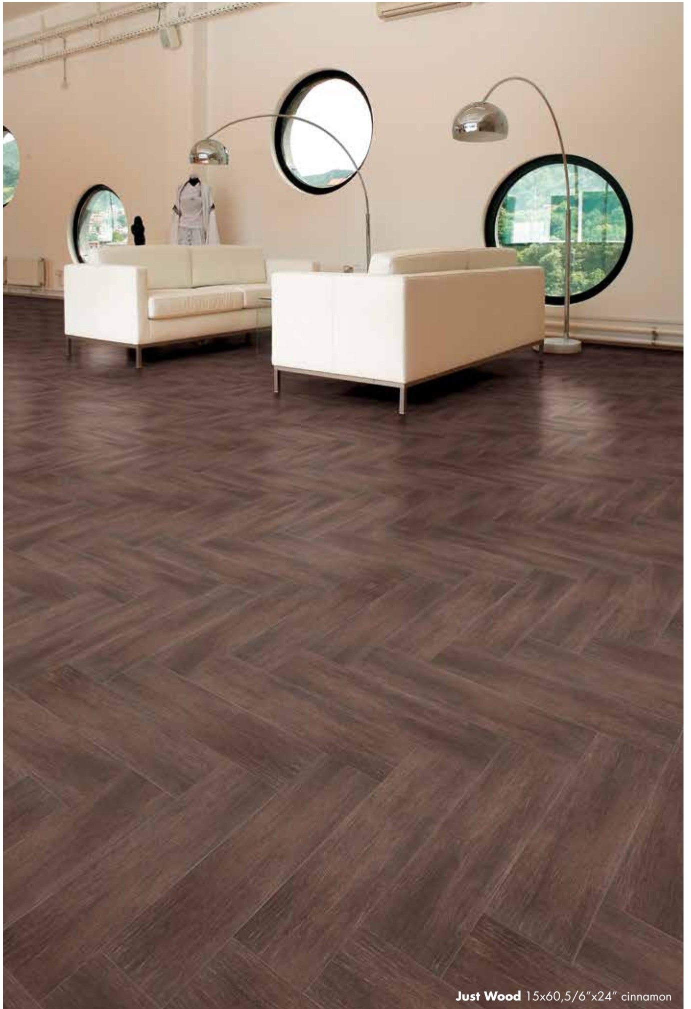
Just Wood 15x60,5/6"x24" cinnamon