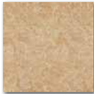
Ilary beige 15x15/6"x6" 4