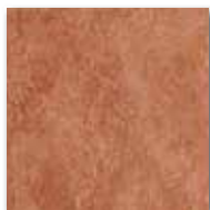
Ilary caldera 15x15/6"x6" 4