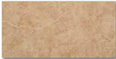
Ilary beige 15x30/6"x12" 5