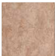
Ilary marron 15x15/6"x6" 4