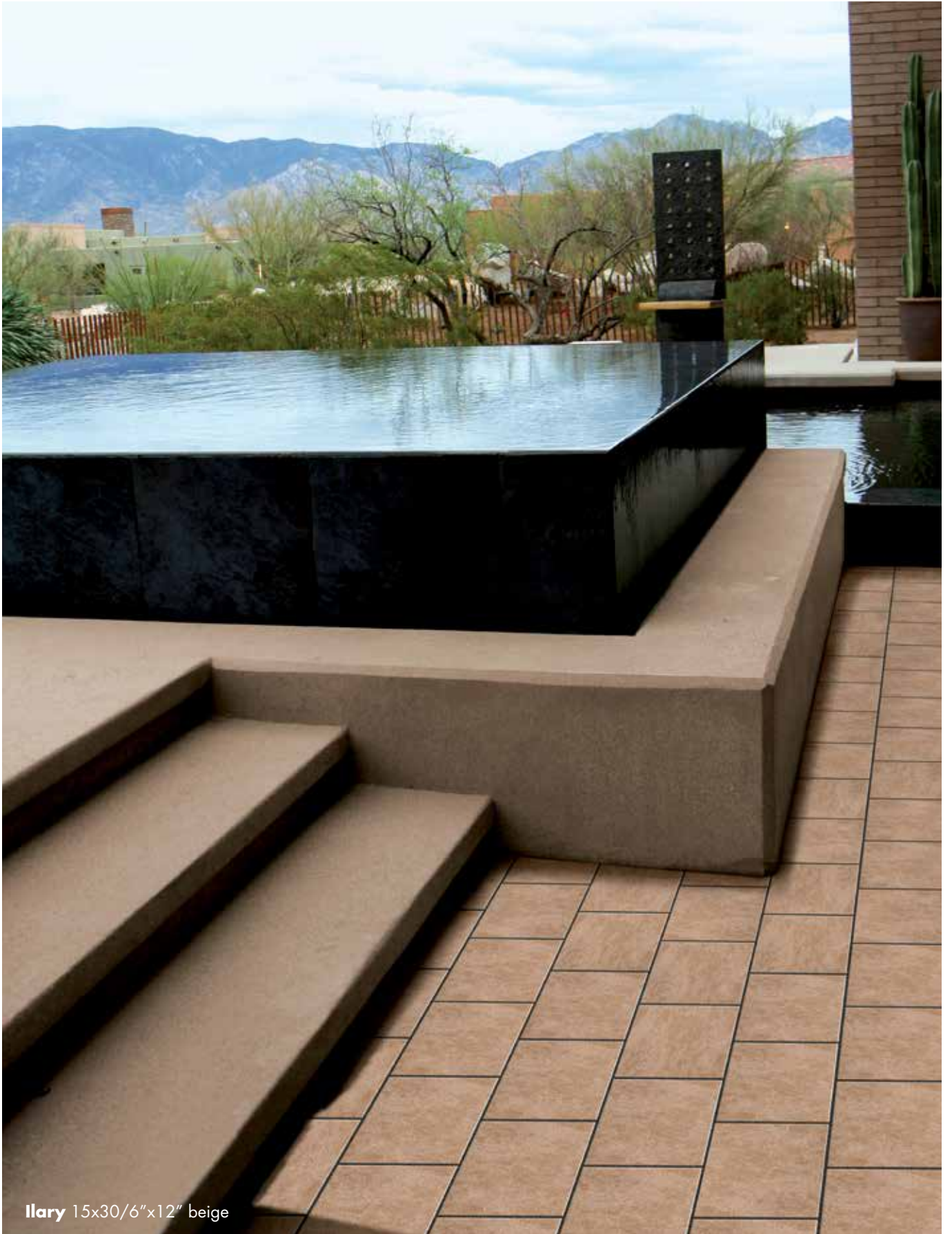
Ilary 15x30/6"x12" beige