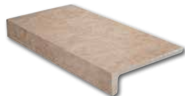
Ilary marron elle monolitico 16,5x30/6,5"x12" 36