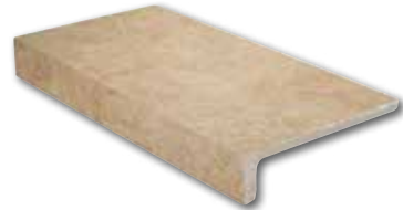
Ilary beige elle monolitico 16,5x30/6,5"x12" 36