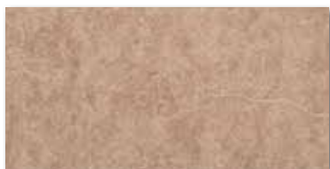
Ilary marron 15x30/6"x12" 5