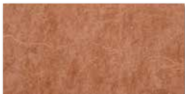
Ilary caldera 15x30/6"x12" 5