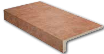
Ilary caldera elle monolitico 16,5x30/6,5"x12" 36