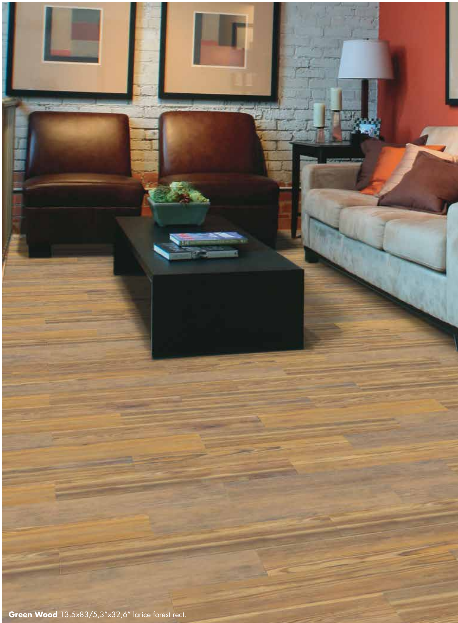
Green Wood 13,5x83/5,3"x32,6" larice forest rect.