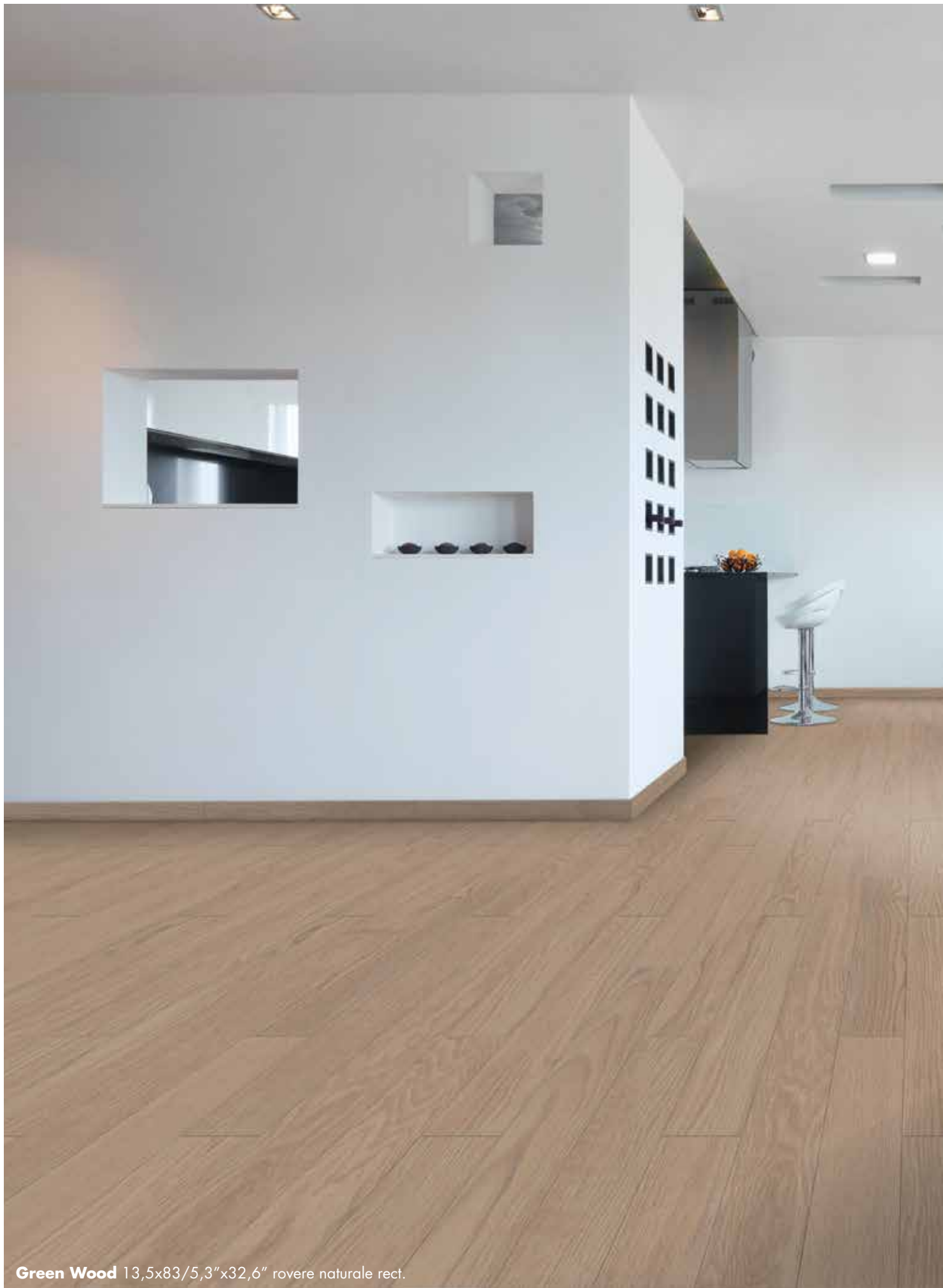
Green Wood 13,5x83/5,3"x32,6" rovere naturale rect.